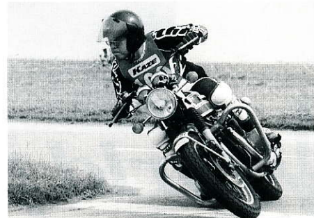
今回の「九州GP」で使用されたコースは、河川敷の特設コースだった