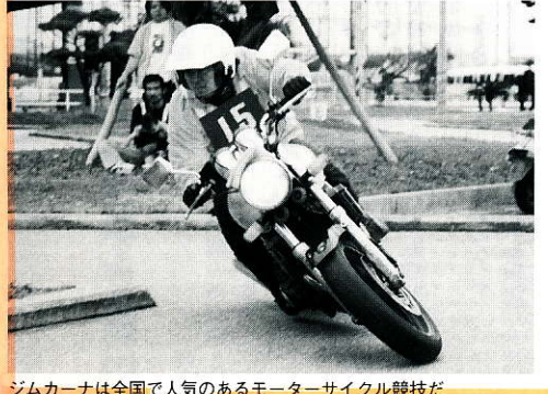
ジムカーナは全国で人気のあるモーターサイクル競技だ

第3戦香川GPは5月30日に香川県坂出市で行われる。お問い合わせは、ジムカーナGP香川大会事務局/☎0877(24)1865